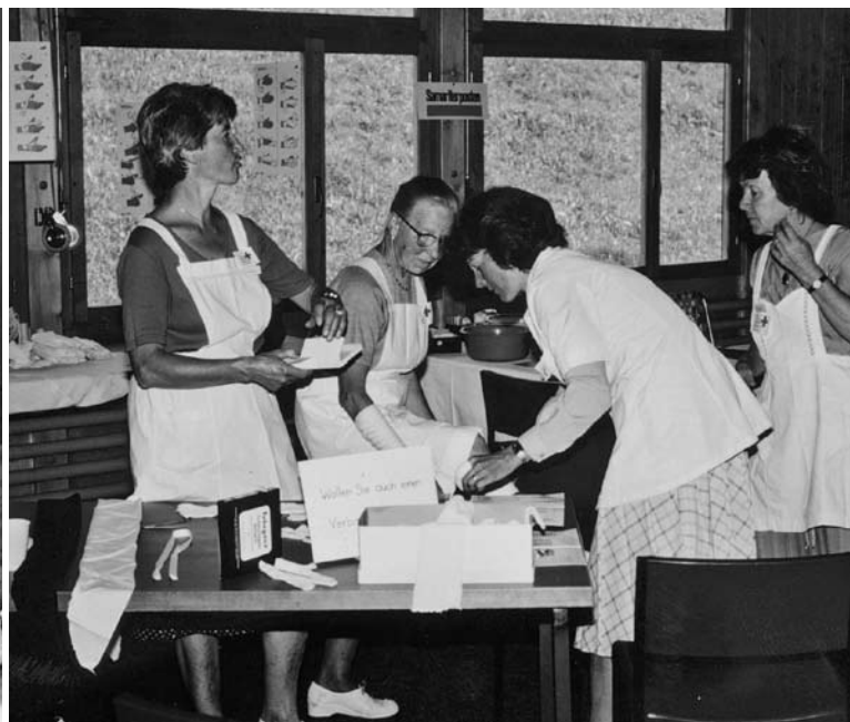
1983 wurde anlässlich des 75jährigen Bestehens des Samaritervereins im Z...