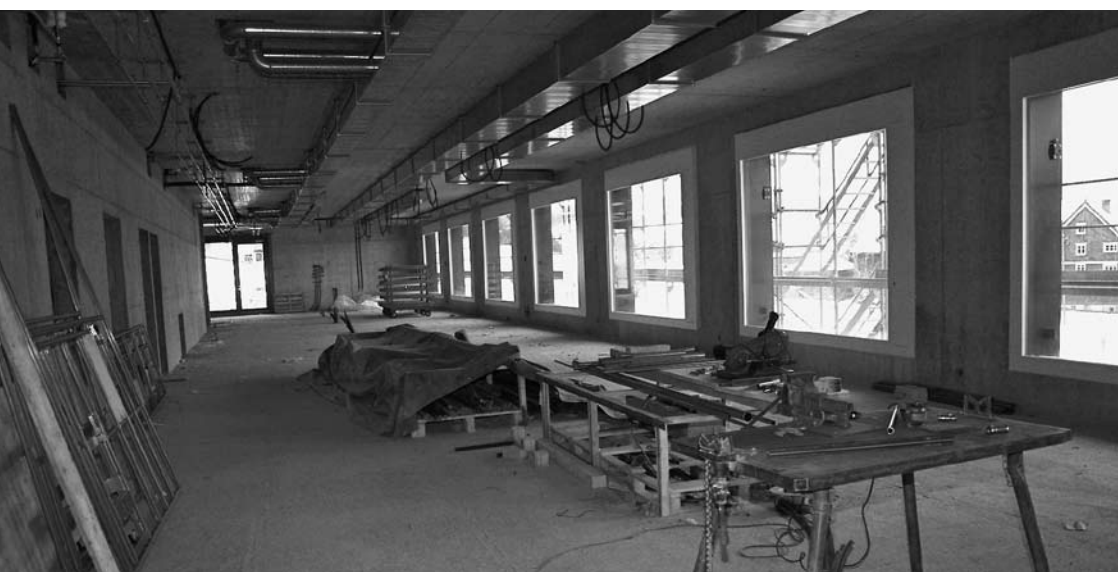
Blick in den künftigen Speisesaal im Erdgeschoss.