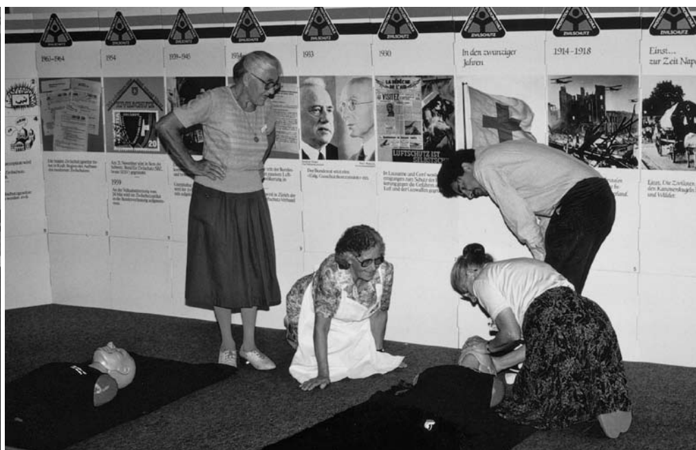
zivilschutzzentrum zu einem Tag der offenen Tür eingeladen.