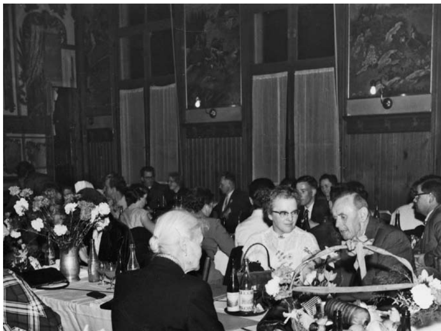
50 Jahre Samariterverein, 1958. Jubiläumsfeier im alten Lindensaal.

Nach dem Krieg folgte die Zeit der Sammlungen: Nationalspende, Flüchtlingshilfe, Rotes Kreuz und Bundesfeierabzeichen. Man sandte Geld, Lebensmittel, Textilien und