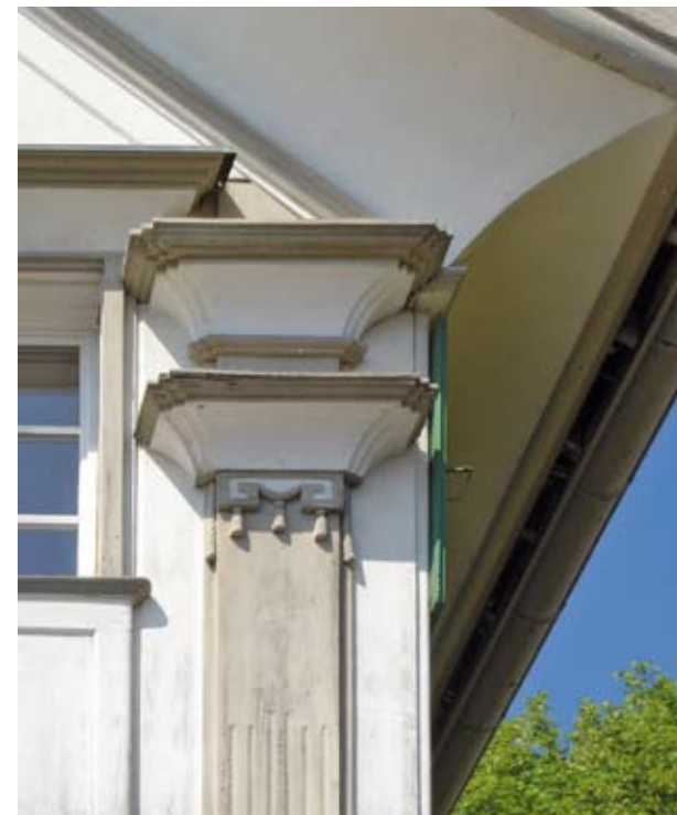
Speicherstrasse 27.