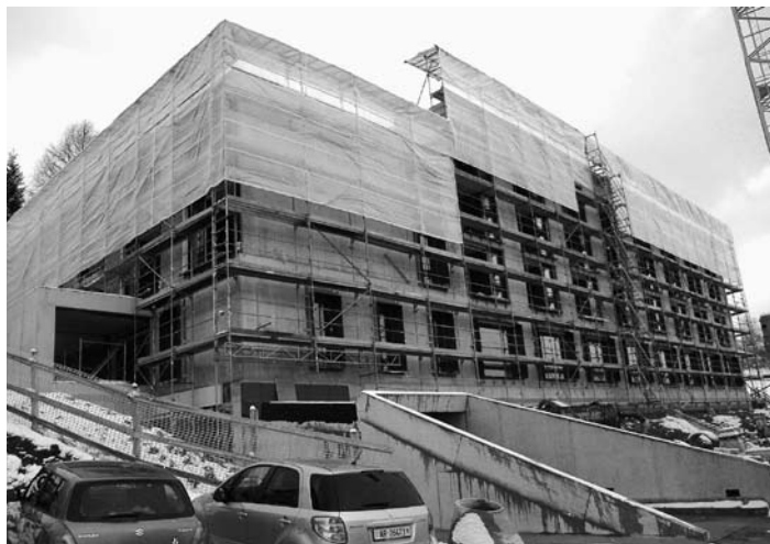
Die Bauarbeiten am «Haus Unteres Gremm» schreiten voran.

Laut Fritz Schiess vom Hochbauamt Teufen übt die Gemeinde in Bezug auf Minergie eine Vorbildfunktion aus. Der ökologische Gedanke spiele bei öffentlichen Neubauten eine immer bedeutsamere Rolle. Er sei stolz darauf, dass das Alterszentrum die Anforderungen, welche an das Minergie-Eco-Label gestellt werden, vollauf erfüllen kann. Es konnte dabei eine energetisch und ökologische Bauweise erreicht werden, welche von der Herstellung der Baumaterialien bis zu deren Rückbau reicht. Dies hat zur Folge, dass die Umwelt nur gering belastet und die natürlichen Ressourcen geschont werden.