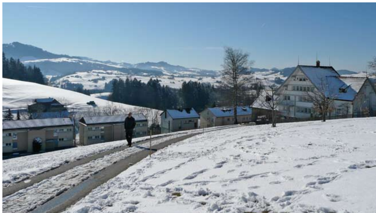
Von welchem Bänkli aus geniesst man diese schöne Aussicht?

79 Stimmberechtigte und einige Gäste nahmen am 15. März an der gutbesuchten 11. Hauptversammlung des Spitex-Vereins Teufen im Lindensaal teil. Die Sachgeschäfte wurden speditiv erledigt. Anstelle der im letzten Sommer verstorbenen Elfriede Giger wurde Esther Bösch Kern (Bild) in den Vorstand gewählt. pd.